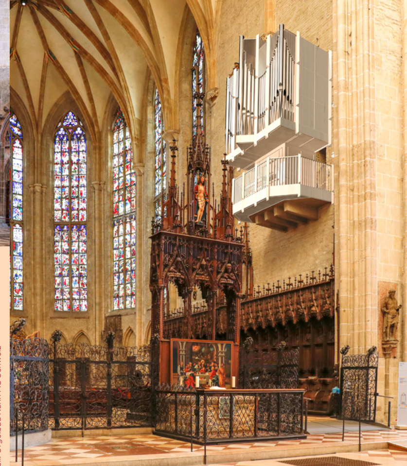
© Gestaltung & Fotos + 3D-Fotomontage: SPIESZDESIGN | © Orgelmodell: Orgelbau Kuhn AG Schweiz